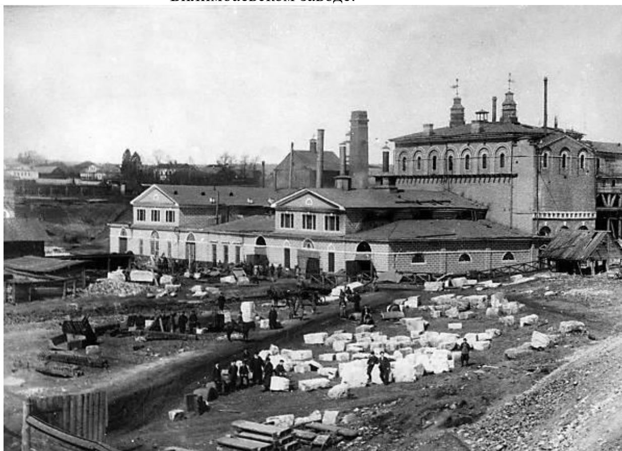
Билимбаевский завод в конце XIX века