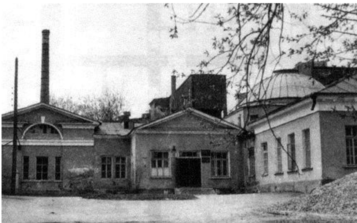
Госпиталь Верх-Исетского завода в начале XX века